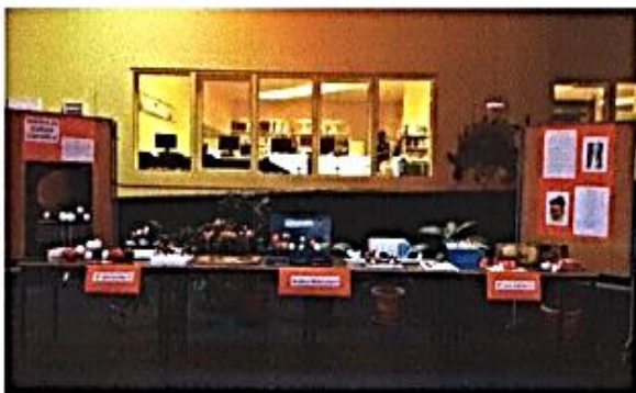
EXPOSIÇÃO de “MODELOS MOLECULARES”